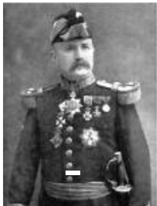
Général LEMAN Commandant de la Place de LIEGE

Le 4 août 1914, lors de la violation de notre territoire par l'armée Allemande, le Général LEMAN avait son Etat-major stationné à LIEGE, quartier de Sainte foi.