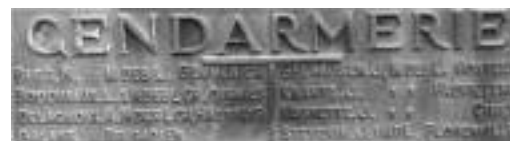
Détail de la plaque commémorative (A l'intérieur du Fort)