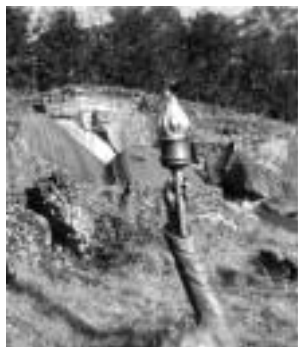
La flamme du souvenir

Dans la partie gauche du fossé gît le Général LEMAN. Il se rendait dans le bureau du commandant quand un souffle violent l'a renversé.